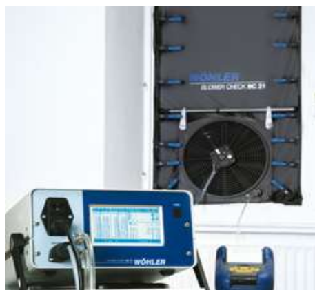
UREĐAJ ZA TLAČNU PROBU