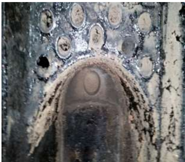
LOŽIŠTE PRIJE ČIŠĆENJA

Kako izgledaju ložište kotla prije i nakon stručno obavljenih dimnjačarskih poslova, u što se i sami možete uvjeriti.