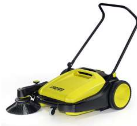
STROJ ZA ČIŠĆ.ZAČAĐ.POVRŠINE