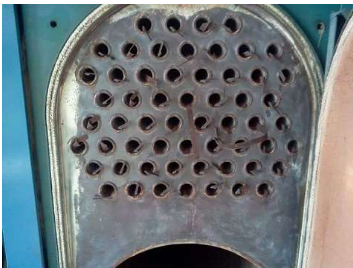
LOŽIŠTE POSLIJE ČIŠĆENJA