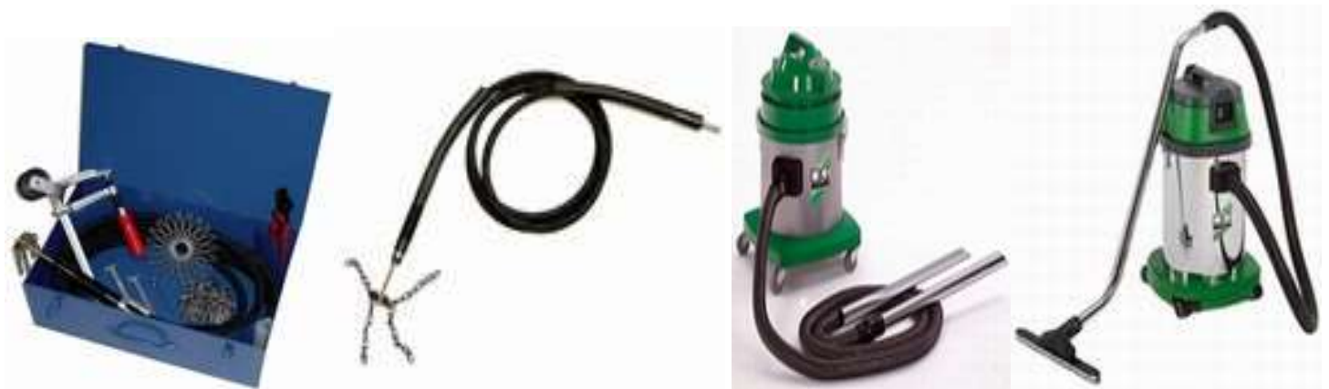
Usisavači Remko RK 50, 27 litara